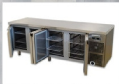
Климатические камеры и печи