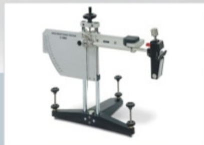
Установки для испытания заполнителей