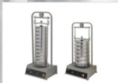
Устройства для отсева и взвешивания

Наша широкая линейка оборудования была тщательно спроектирована и изготовлена для обеспечения превосходных результатов испытаний, удовлетворяющих любые Ваши требования.