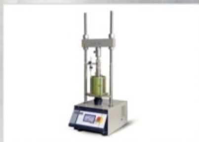
Несущая способность: показатель несущей способности грунта (калифорнийский метод), плотность по Проктору, текучесть по Маршаллу, испытание несущей способности грунта при помощи нагруженной плиты