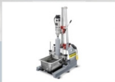
Взятие кернов и отбор проб