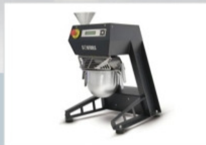
Смесители и оборудование для подготовки образцов