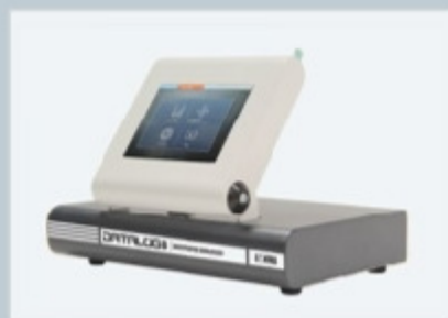
Измерительные инструменты: датчики, регистраторы данных, программное обеспечение