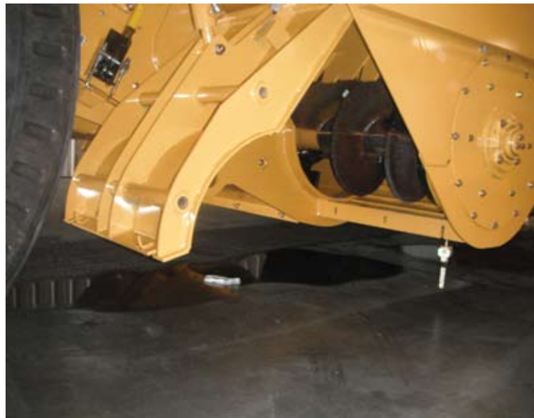
Широкий сервисный люк бункера-накопителя на машине E2850

Среди интересных опций, которые предлагает производитель для обеих модификаций – централизованная система смазки, гидравлический генератор, а также управление задними колесами, которое позво-