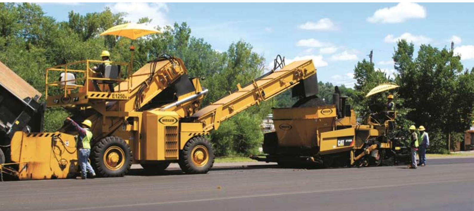
Перегружатель Weiler E1250

Сегодня БиЭйВи предлагает российским дорожникам современные антисегрегационные перегружате-