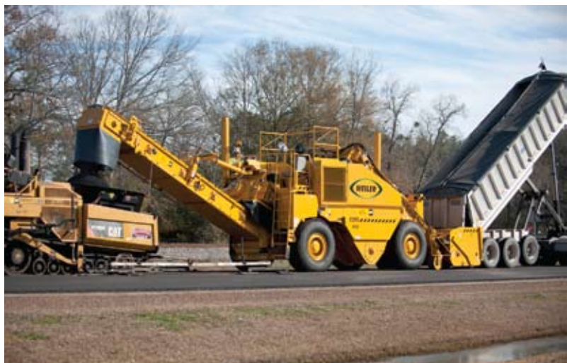
Перегружатель Weiler E2850_1